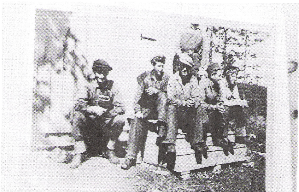
Skogsarbetarlag i Lansjärv